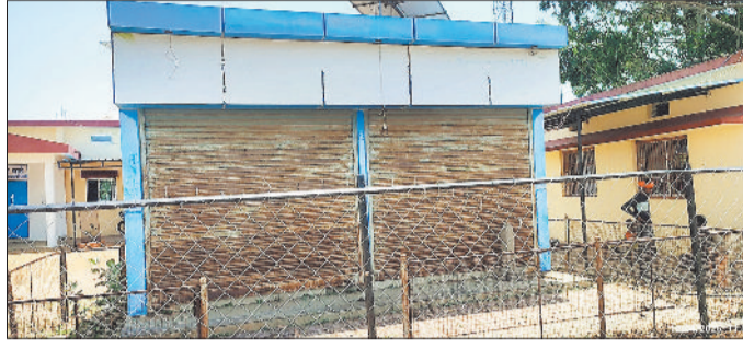
बंद कोरिया नीर।

इस तरह लाखों खर्च करने के बाद भी विभिन्न जगहों पर स्थापित वाटर एटीएम से लोगों को एक बूंद भी पेयजल नहीं मिल पा रहा है। ऐसा ही हाल कोरिया जिले के सोनहत जनपद अंतर्गत जल क्रांति अभियान ग्राम कटगोड़ी की है। जनकारी के अनुसार जल ग्राम कटगोड़ी में अस्पताल परिसर के पास लाखों खर्च कर कोरिया नीर वाटर एटीएम स्थापित किया गया है जो लंबे समय से बंद पड़ा है, इसके सुधार करने की दिशा में संचालन के लिए जिम्मेदार विभाग के जिम्मेदार अधिकारी ध्यान नहीं दे रहे हैं और न ही पंचायत प्रतिनिधियों ने भी बंद पड़े कोरिया नीर वाटर एटीएम को चालू कराने की दिशा में गंभीरता से पहल नहीं कर रहे हैं, इसके चलते ग्राम कटगोड़ी में अस्पताल परिसर के पास स्थापित कोरिया नीर वाटर एटीएम बंद स्थापित होने के बाद