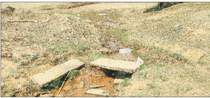
पाइप से भरते हैं पानी

से बंद पड़ा है। उल्लेखनीय है कि कोरिया जिले का ग्राम कटगोड़ी जल क्रांति अभियान ग्राम है तथा ग्राम पंचायत कटगोड़ी को आदर्श पंचायत का दर्जा दिया गया है, लेकिन यहाँ गर्मी शुरू होने के साथ ही पेयजल संकट का सामना लोगों को करना पड़ता है। आदर्श ग्राम में तो पेयजल की सुविधा सुव्यवस्थित होनी चाहिए,